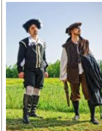
Due attori di L'Archibugio