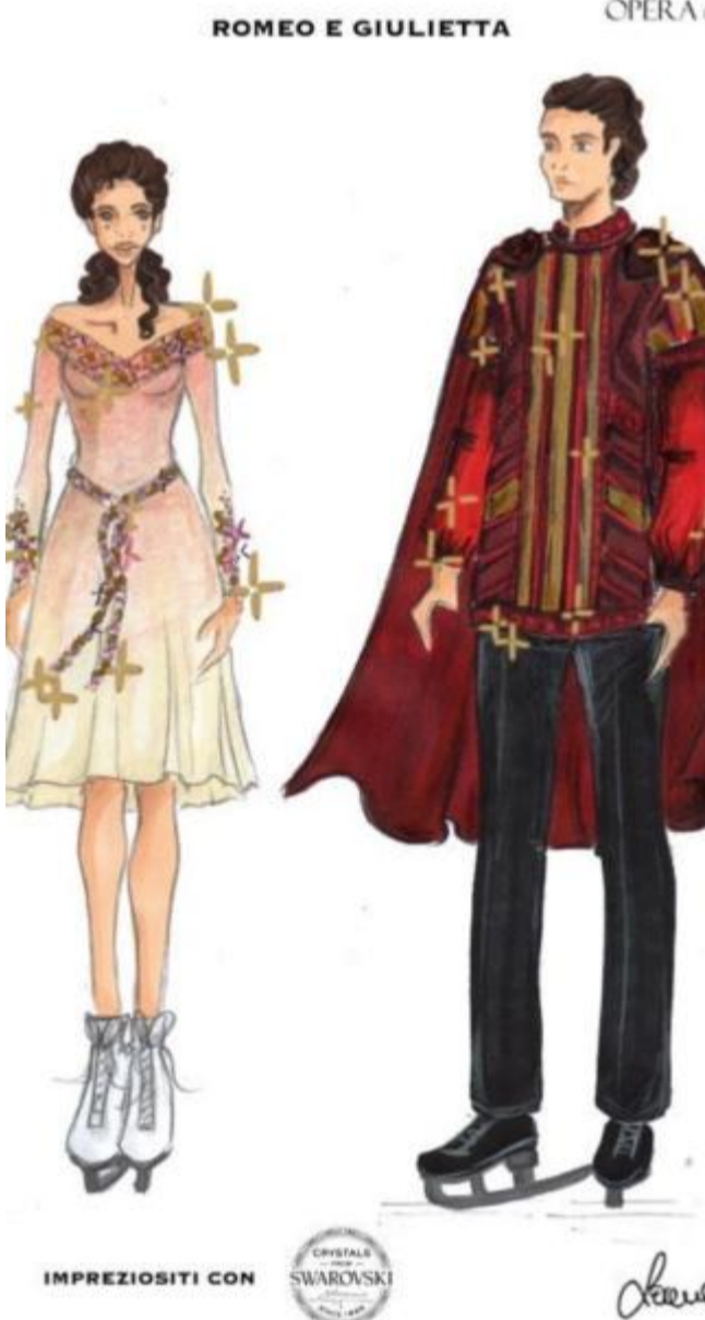
Due abiti del gruppo Hera per il progetto Scart con gli Swarovski

Sullo sfondo del ramo dei Colli Berici che volge a Meridione si dipanano intrighi, rapimenti e duelli in un allestimento attento al costume e alla lingua dell'epoca. Al termine di ogni turno si terrà il concerto "L'Amore Rubato", polifonia rinascimentale con la "Libera Cantoria Pisani", rinfresco con i sapori del tempo e degustazione del vino "Don Rodrigo" a tiratura limitata a cura della pro loco e della cantina Cavazza. In apertura sarà proiettato un video riassuntivo delle apparizioni di Orgiano nei principali media. Ingresso 5 euro (solo in caso di rinuncia degli aventi diritto). • L.G.U.