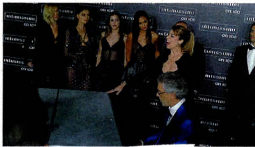
Mozzafiato Sopra, una delle top model sul red carpet, forse la più famosa: Irina Shayk. A fianco, Andrea Bocelli con le modelle canta prima dello show