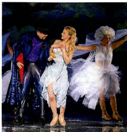
Luci in piazza Bra

A sinistra e sopra due momenti dello spettacolo: l'Arena gremita e le coreografie coloratissime (a sinistra), e (sopra) la pattinatrice Kira Korpi, stella sul ghiaccio insieme a Evgheni Plushenko e ovviamente Carolina Kostner, la veterana dello show