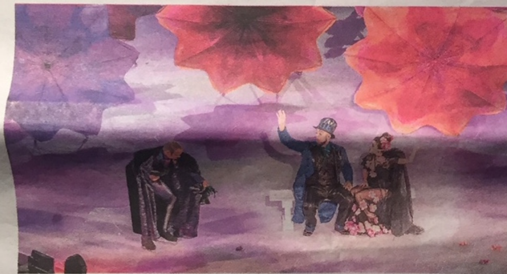
Intimissimi On Ice - qui un momento dell'edizione 2016 - torna ad infiammare l'Arena

Da Shizuka Arakawa allo «zar» Evgeni Plushenko i fenomeni in pista per «Intimissimi on ice 2017» Tra il pubblico attrici, top model, sportive, dive della tv