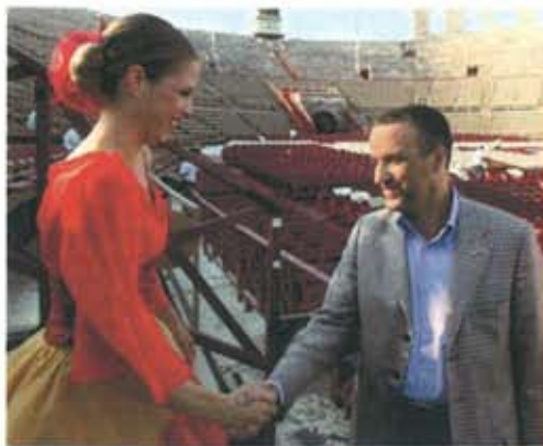
Verona. Carolina Kostner e il sindaco Flavio Tosi, che è presidente della Fondazione Arena di Verona.

che i giornali si occupano di atleti come la Pellegrini e Magnini più per le loro vicende sentimentali che per quelle sportive?