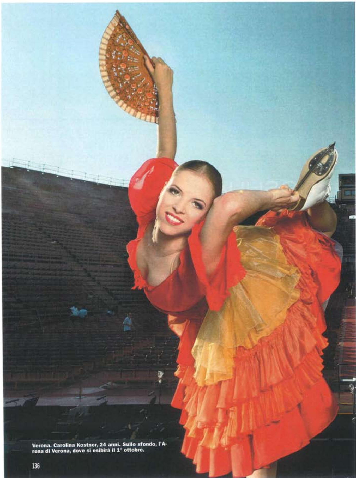
Verona. Carolina Kostner, 24 anni. Sullo sfondo, l'Arena di Verona, dove si esibirà il 1° ottobre.